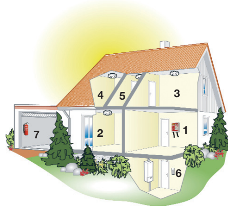
Brandschutz-Sicherheitsmaßnahmen für das ganze Haus.

Ohne den Teufel gleich an die Wand zu malen, lassen sich für relativ kleines Geld mit nur wenig Zeit- und Montageaufwand Sicherheitsmaßnahmen rund um das Thema Rauch, Feuer und Gas installieren, die im Ernstfall Leben