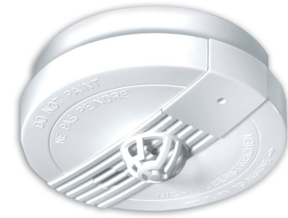
Unempfindlich gegen Dunst, Staub und Abgase alarmieren Hitzemelder, wenn Feuer ausgebrochen ist.

Überall dort, wo im normalen Alltag Kochdämpfe, Abgase oder Staub entstehen, sind Rauchmelder ungeeignet, da diese zu häufigen Fehlalarmen führen würden. Für Küche, Hobbykeller, Werkstatt oder auch Garage gibt es jetzt eine clevere Alternative im GEV-Regal: Hitzemelder, die unempfindlich gegen Schmutz, Staub und Dämpfe sind und bei Anstieg der Raumtemperatur auf über 60° C einen lautstarken Ton auslösen (85 Dezibel in 3 m Entfernung).