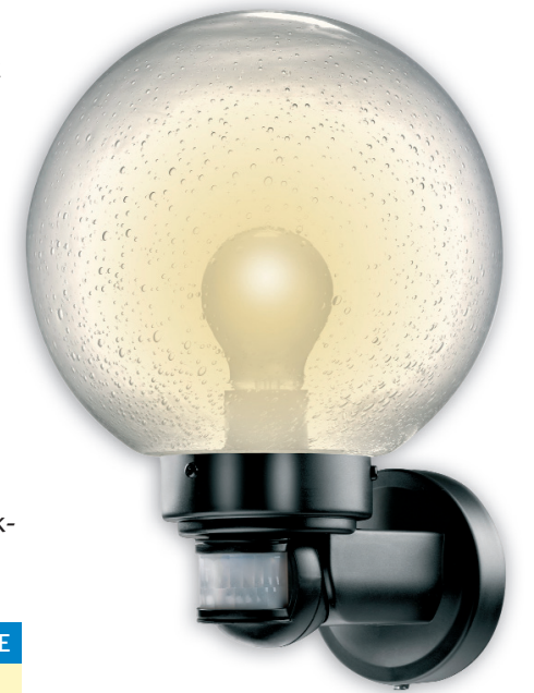
Aktionsangebot: Die Verpackungseinheit fasst 6 Leuchten zum Brutto-Endverbraucherpreis von nur je 19,99 Euro.

Montagehöhe von ca. 1,80 m verfügt der integrierte Bewegungsmelder über Erfassungsreichweiten von 3 bis ca. 12 m. Die Montage in Innen- bzw. Außenecken eines Hauses ist mit dem entsprechenden Ecksockelzubehör ebenfalls kein Problem. Ob für die schwarze oder weiße Ausführung – die Systemgläser des Multitalents sind noch lange nachbestellbar. Und das kann sich lohnen, denn GEV gewährt auf jedes Produkt 36 Monate Technikgarantie.