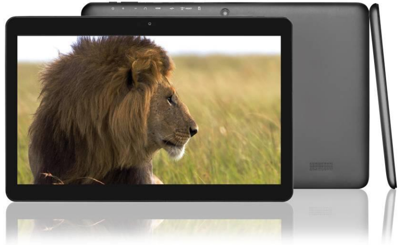
Endeavour 1100 und 1013