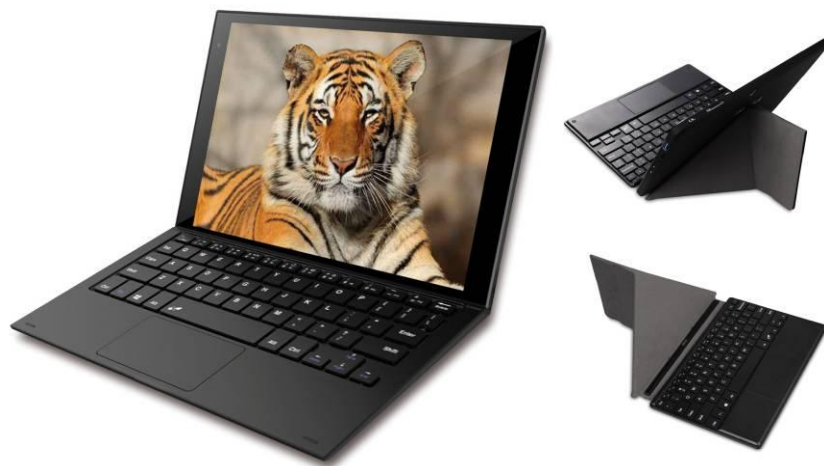
Discovery 1010WI mit Tastatur